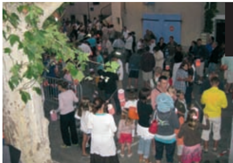
13 juillet : défilé aux lampions pour la fête nationale.