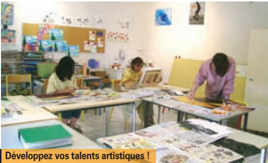
Développez vos talents artistiques !

Renseignements 04 42 46 34 52 ou casl_velaux@yahoo.fr