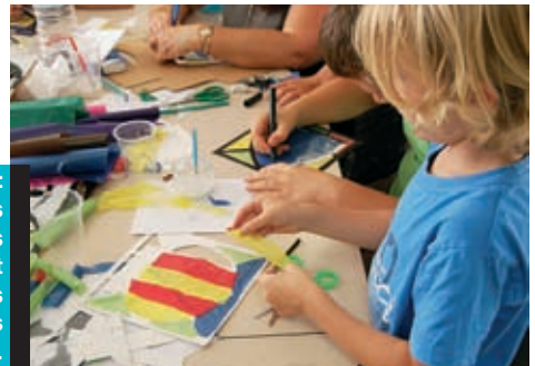
27 juillet : les petits Velauxiens découvrent l'art du vitrail à travers les ateliers du patrimoine.