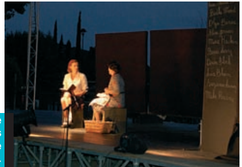
8 juillet : soirée théâtre dans le cadre des Velauscènes.