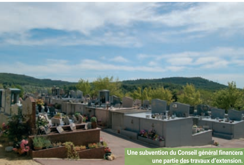
Une subvention du Conseil général financera une partie des travaux d'extension.

Cette page vous apporte un éclairage sur certains points à l'ordre du jour du Conseil municipal du 7 juillet. Le compte-rendu est disponible dans son intégralité sur www.velaux.fr , rubrique mairie