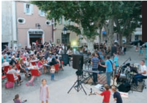
21 juin : place comble dans le village pour la fête de la musique, comme aux Quatre Tours et à la Colline.

NOUVEAU Le flashcode est une sorte de code barre qui, photographié par un téléphone portable de dernière génération, permet d'accéder à la photothèque du site internet de la ville. Pour la parcourir, il vous suffit de télécharger gratuitement l'application. Une façon originale de rester connecté à l'actualité !