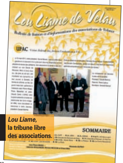
Lou Liame, la tribune libre des associations.

Renseignements 04 42 87 73 61 - scecom@mairie-de-velaux.fr Retrouvez les publications de la ville sur www.velaux.fr