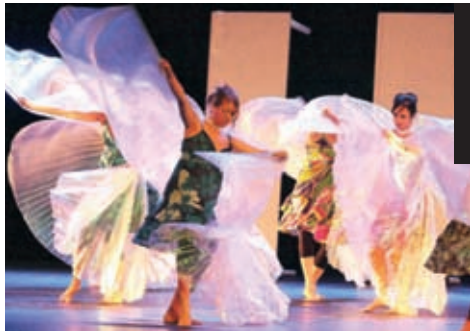
22 juin : les danseuses du CASL se produisent pour la première fois dans l'Espace NoVa.

NOUVEAU Le flashcode est une sorte de code barre qui, photographié par un téléphone portable de dernière génération, permet d'accéder à la photothèque du site internet de la ville. Pour la parcourir, il vous suffit de télécharger gratuitement l'application. Une façon originale de rester connecté à l'actualité !