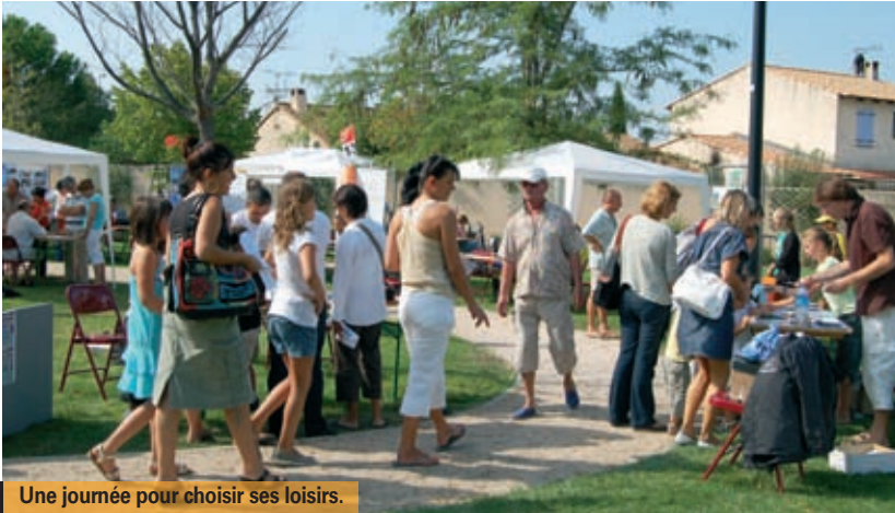
Une journée pour choisir ses loisirs.

le large panel d'activités proposé par les structures associatives sur la commune. Musique, théâtre, danse, photo, lecture, etc. sont autant de domaines représentés lors de cette journée