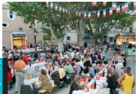
10 août : franc succès pour le "repas tripes" organisé par le Comité des Fêtes.