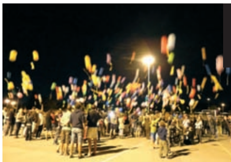
9 août : le lâcher de ballons donne le top départ du feu d'artifice de la Saint Éloi.