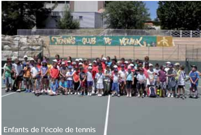
Enfants de l'école de tennis