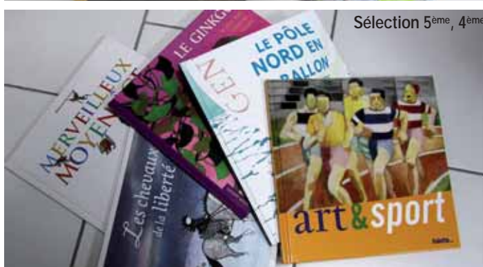
Sélection 5 ème , 4 ème