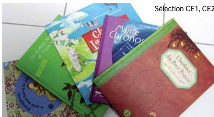
Sélection CE1, CE2