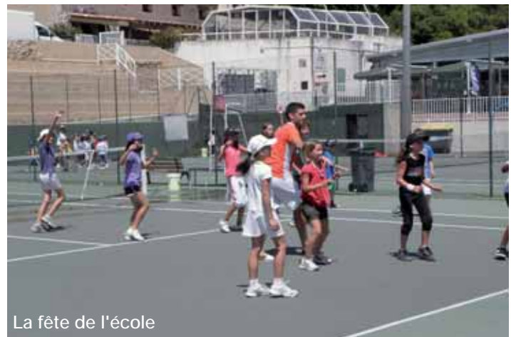
La fête de l'école

Tout au long de l'année une commission dynamique prépare diverses animations . De la compétition, avec les tournois homologués mais aussi des animations ludiques et conviviales comme le téléthon, la journée multisports, les tournois double hommes et double mixte... Et aussi les soirées dansantes !