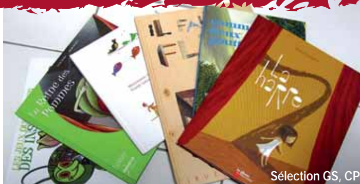
Sélection GS, CP