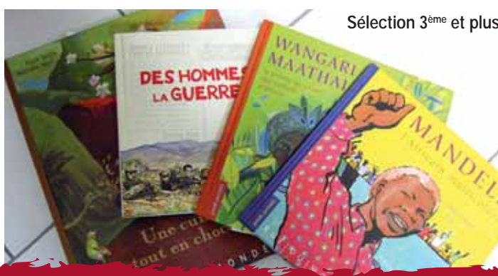
Sélection 3 ème et plus