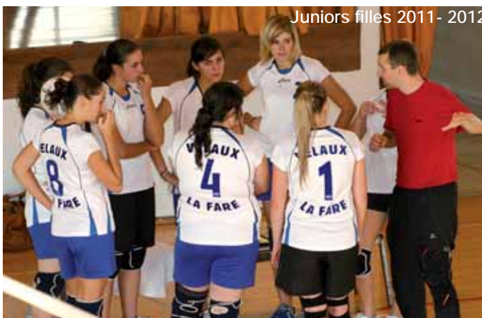
Juniors filles 2011- 2012

Tous les entraîneurs sont diplômés d'Etat (BEES1 volley-ball) ou FFVB (Entraîneurs Régional ER1, ER2, EF1, Educateurs école de volley (5) et Responsables école de volley (2)).