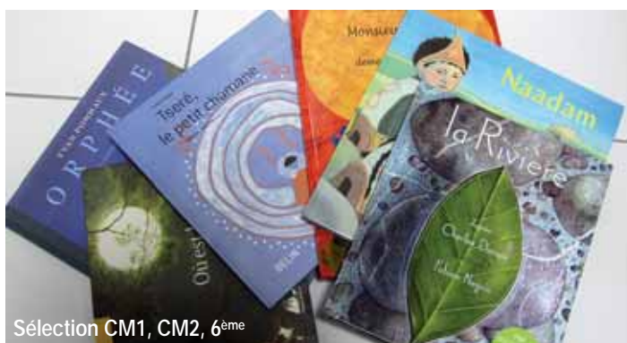
Sélection CM1, CM2, 6 ème