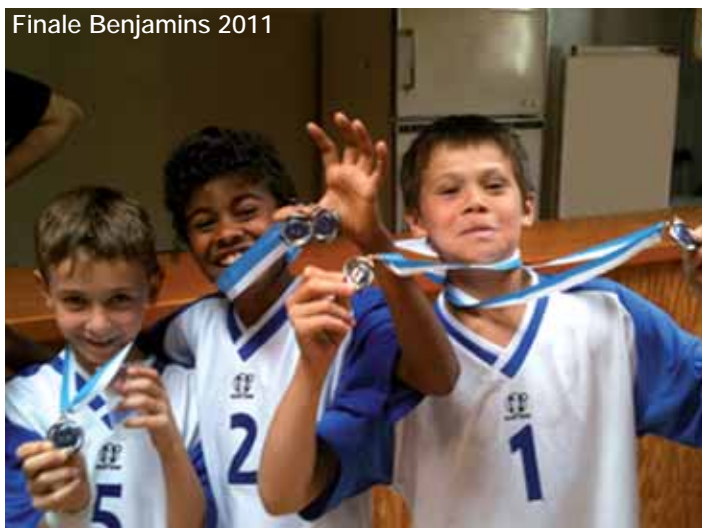
Finale Benjamins 2011