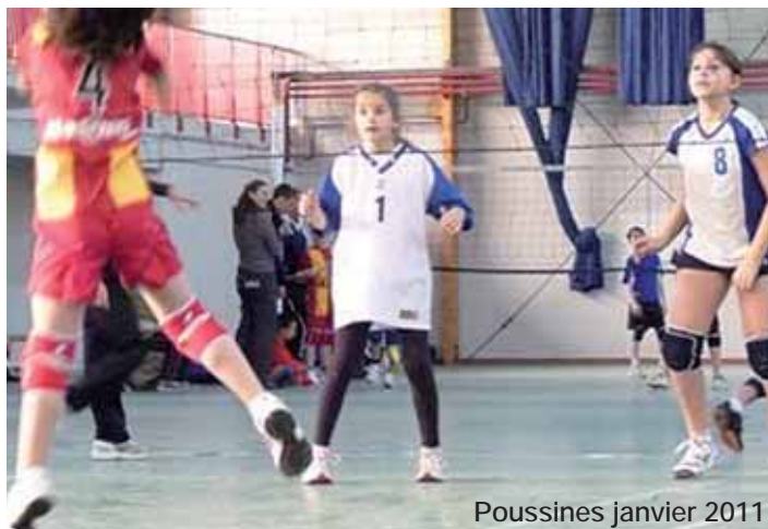
Poussines janvier 2011

Pour jouer un jour en championnat Régional Cadets ou juniors