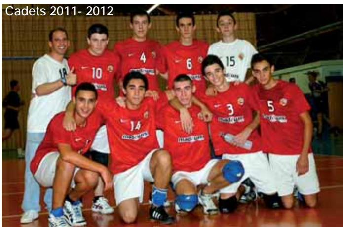
Cadets 2011- 2012