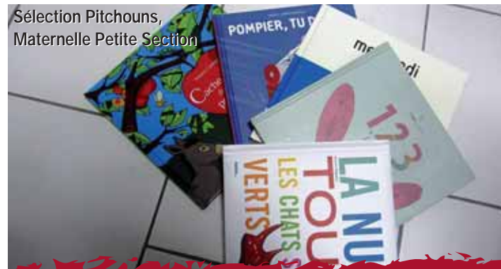
Sélection Pitchouns, Maternelle Petite Section

A retenir : assemblée générale le vendredi 13 janvier 2012