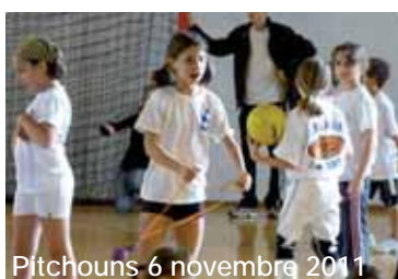
Pitchouns 6 novembre 2011

A près tes premiers pas au baby volley, tu pourras dès 5 ans participer à des plateaux de rencontres PITCHOUNS VOLLEY pour tes débuts en compétition