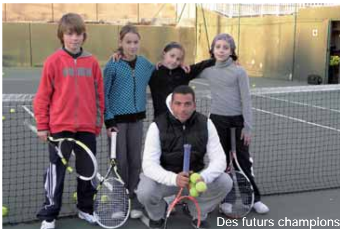
Des futurs champions