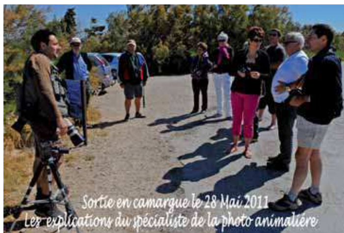
Sortie en camargue le 28 Mai 2011 Les explications du spécialiste de la photo animalière