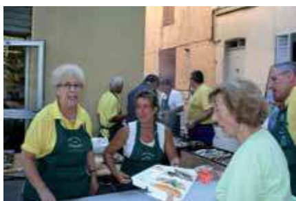
14 JUILLET , en matinée Jeux pour les enfants sous les ombrages de la place F. Caire, en soirée Grande Sardinade.