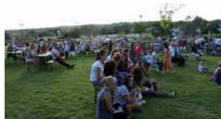
Fête de la Musique lundi 21 juin au Théâtre de Verdure (parc des 4 Tours).