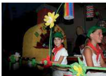
Mototo-Pizzas (Mot' Auto Club)