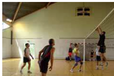
Tournoi open 2009

Tous les entraîneurs sont diplômés d'état (BEES1 volley ball) ou FFVB (Entraîneurs Régional ER1, ER2, EF1, Educateurs école de volley (5) et responsables école de volley (2)).