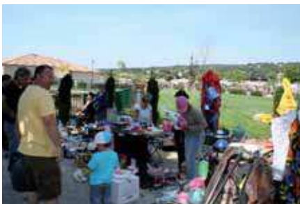
VIDE-GRENIER de Printemps Dimanche 2 mai au parc des 4 Tours.