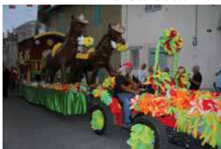
La Roulotte des gitans (ARAC)

Grand Corso avec la participation des Associations de Velaux, les Myster's Blues et leur Pena, l'Estrambord de Velaux et nos amis Italiens : Musici et Alfieri Sbandieratori De Dovara et Improvsta, remerciements aux résidents de la maison de retraite de l'Arbois.