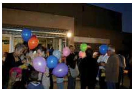
Lâcher de ballons