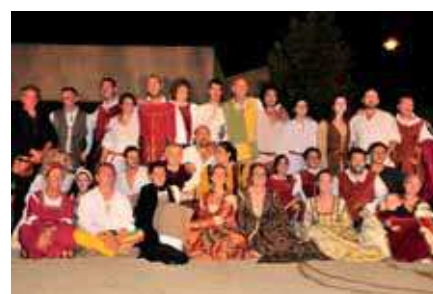
Spectacle folklorique avec nos Amis Italiens