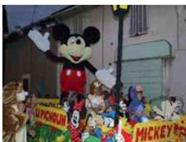
Mickey et ses amis (Li Pichoun)