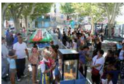
Mardi 9 août : jeux gonflables pour les enfants