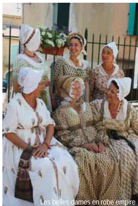
Les belles dames en robe empire