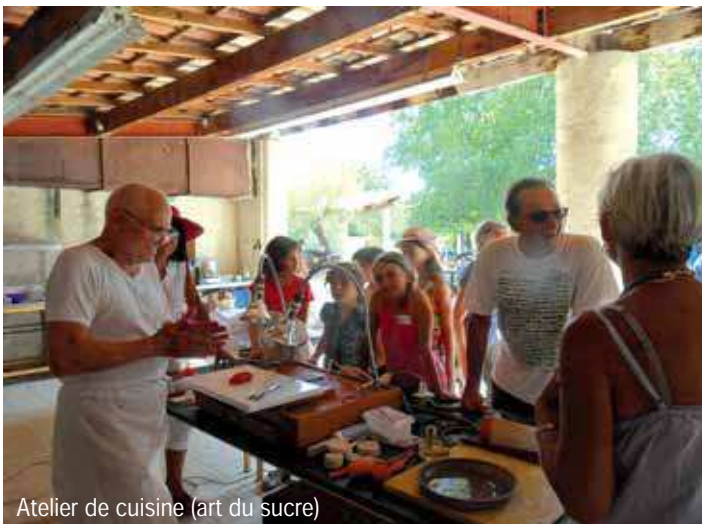
Atelier de cuisine (art du sucre)