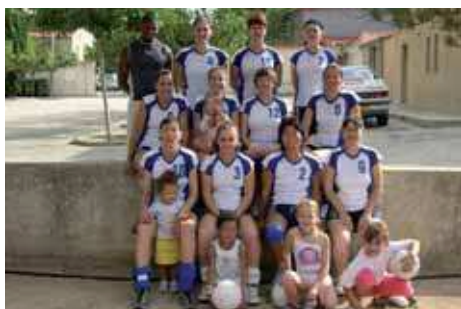
Seniors filles 2006