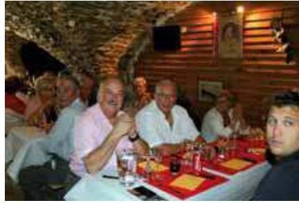
Sortie du Comité des Fêtes à "Randals Bison" avec remise des Diplômes et médailles à nos chers membres méritants.