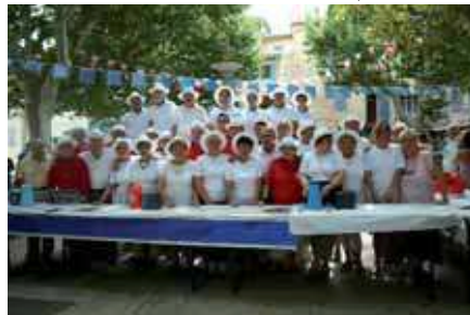
Apéritif-concert à toute la population