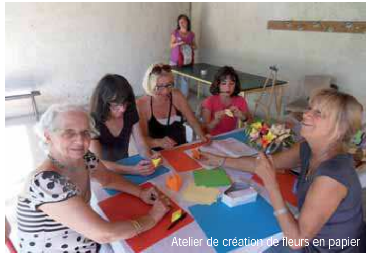
Atelier de création de fleurs en papier

Au sein des SEL, beaucoup sont très impliqués dans les réflexions autour des problèmes de société et l'évolution de celle-ci, ce qui amène l'organisation régulière de débats lors des journées de rencontres InterSel, débats qui se poursuivent souvent par le canal d'Internet et des échanges de courriels. Car la pratique des SEL nous amène logiquement à une réflexion sur la problématique engendrée par la contradiction entre notre vie dans la société marchande et mercantile et les valeurs que tentent de défendre les SEL.