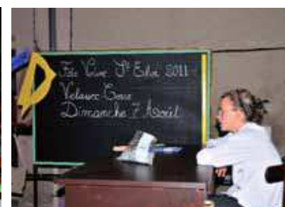
La classe en 1930 (Comité des Fêtes)