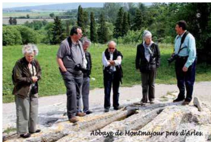
Abbaye de Montmajour près d'Arles.