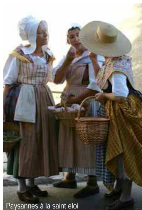
Paysannes à la saint eloi