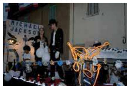
Michael JACKSON (Aurore)