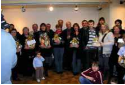
Remise des Prix du 15 ème Concours de Crèches Provençales le vendredi 21 janvier à la Salle des Fêtes.