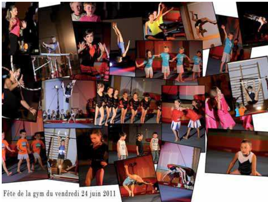
Fête de la gym du vendredi 24 juin 2011