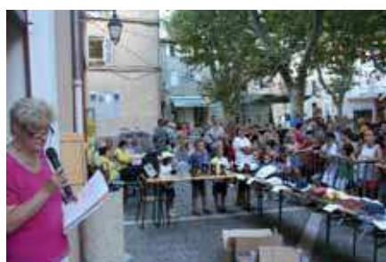
Le Cross de la Saint Eloi