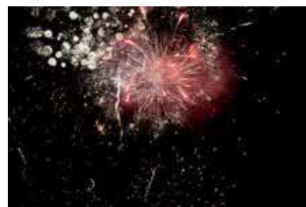
suivi du spectacle pyrotechnique