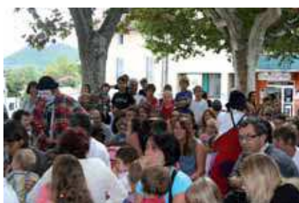
Lundi 8 août : clowns "Les martos"