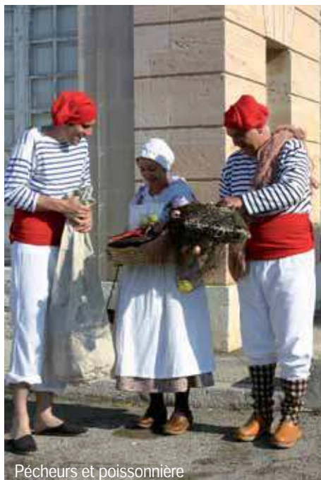
Pêcheurs et poissonnière