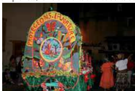
Protégeons la nature (CCFF)