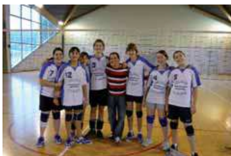
Minimes filles 2007