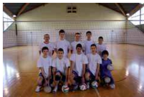
Minimes garçons 2010