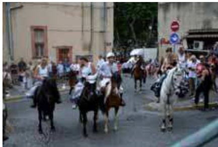
Bénédictin des cavaliers