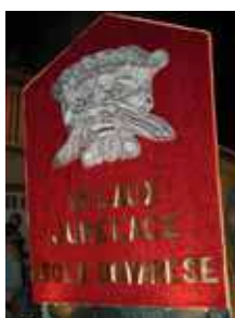
Isola Dovarese (Velaux Jumelage)