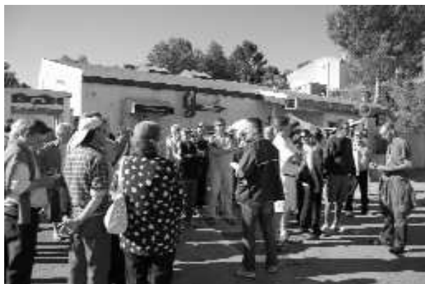
Les facteurs devant La Poste, lors de la journée de grève.

Une réorganisation qui aura, non seulement un impact sur la qualité du service rendu à la population, mais aussi sur les conditions de travail des facteurs, qui devront alors effectuer des trajets supplémentaires, en deux roues, sur des routes particulièrement accidentogènes. La possibilité que les bureaux de Ventabren et Coudoux soient, à terme, transformés en Point Poste a également été évoquée lors de la réunion publique. Ceci obligerait les usagers de ces deux communes à se rendre à Velaux pour de nombreuses opérations, bureau dont les deux guichets sont déjà souvent insuffisants.