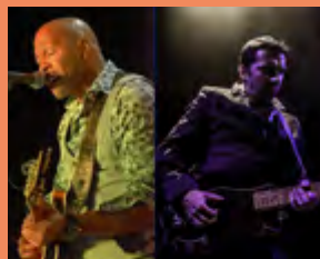
MERCREDI 19 AOÛT LOOK & SHARP TRIO