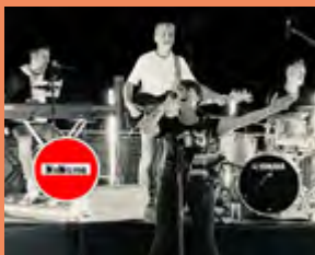
MERCREDI 12 AOÛT NO NAME