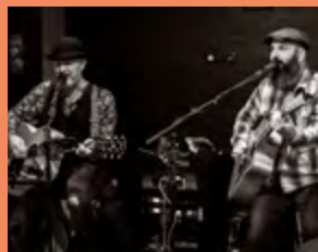
MERCREDI 8 JUILLET PUSSY DUO