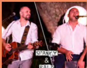
MERCREDI 24 JUIN SPANKY DUO