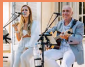
MERCREDI 29 JUILLET DAD & I