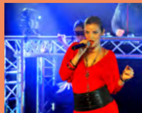
MERCREDI 26 AOÛT SUCCESS