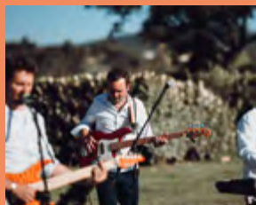
MERCREDI 22 JUILLET NYX (SOIRÉE CORSE)