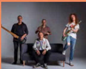
MERCREDI 1 ER JUILLET LOLA TRIO